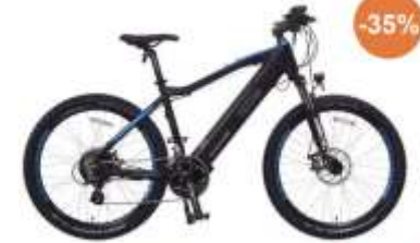
Vélo Tout Terrain - NCM / M3

Au prix de 1.339,40 € au lieu de 2.649 € . Soit 1.059,60 € de réduction et 250 € de subvention*.