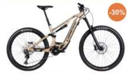
Vélo Tout Terrain - LAPIERRE / OVERVOLT AM 5.6

Au prix de 3.359,30 € au lieu de 5.299 € . Soit 1.589,70 € de réduction et 350 € de subvention*.