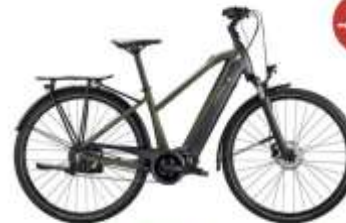
Vélo Urbain premium - BIANCHI / T-TRONIK

Au prix de 789,35 € au lieu de 1.599 € . Soit 559,65 € de réduction et 250 € de subvention*.