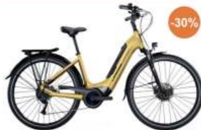
Vélo Urbain - LAPIERRE / E-URBAN 3.5

Au prix de 1.429,35 € au lieu de 2.199 € . Soit 769,65 € de réduction.