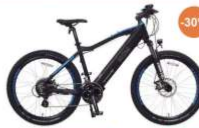
Vélo Urbain premium - LAPIERRE / E-EXPLORER FS 9.7

Au prix de 1.329,30 € au lieu de 2.399 € . Soit 719,70 € de réduction et 350 € de subvention*.